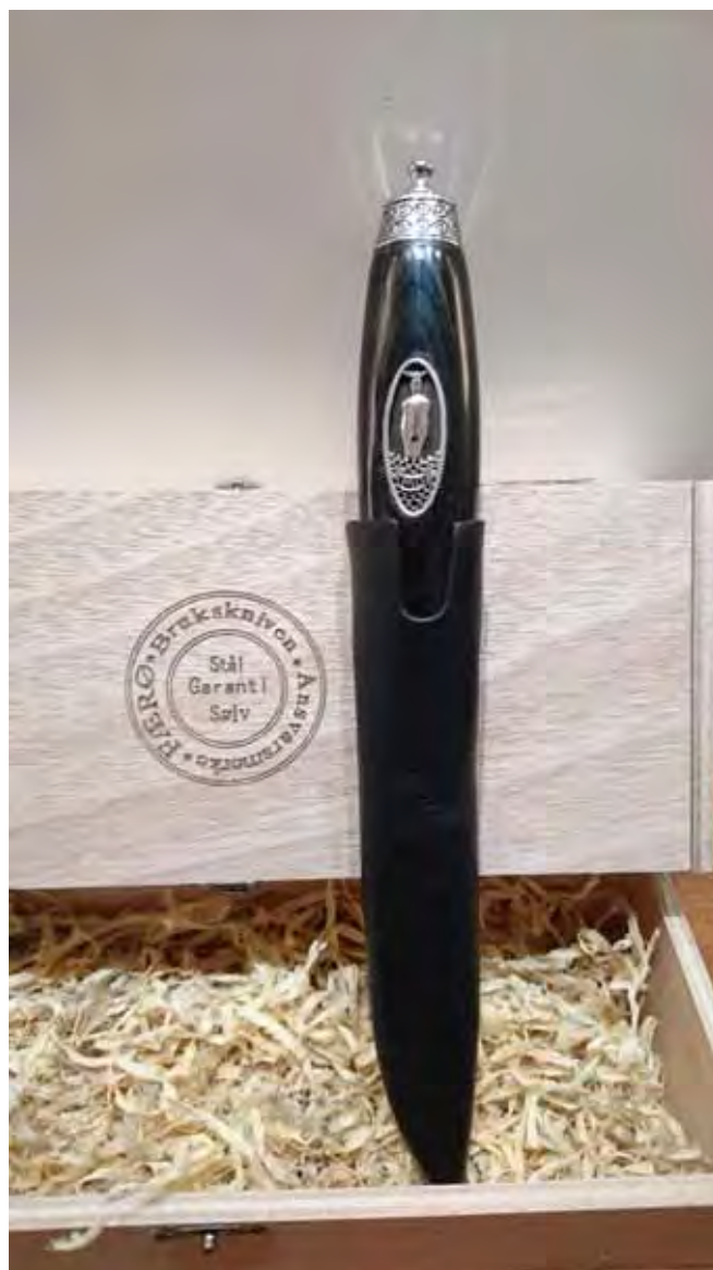
Mestergull Meyer sponser premien for årets beste finalespill