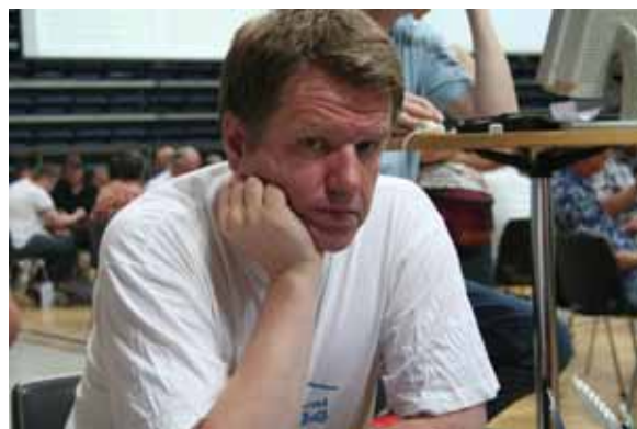
Sven-Olai klar for slem da makker gjennmeldte kløver

Sven-Olai hadde en mulig tilleggssjanse dersom hjerteren ikke lot seg godspille (og den andre hjerterunden ikke ble overstjålet av nord). Da kan han stjele en ruter på hånda og kaste den siste ruter på hjerter konge.