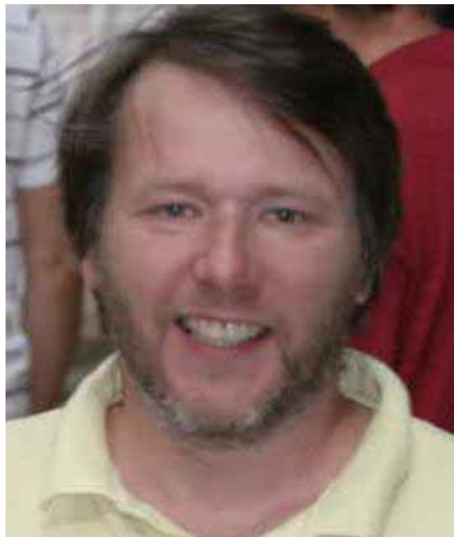
Jim meldte inn på firekortsfargen

Et artig poeng er at denne gang står 7 spar på 4-4-tilpassning, mens det ikke er mulig å hente mer enn elleve stikk på 6-4-tilpassningen i hjerter. 6 spar ble meldt på to bord, mens et par meldte 6 hjerter og gikk bet.