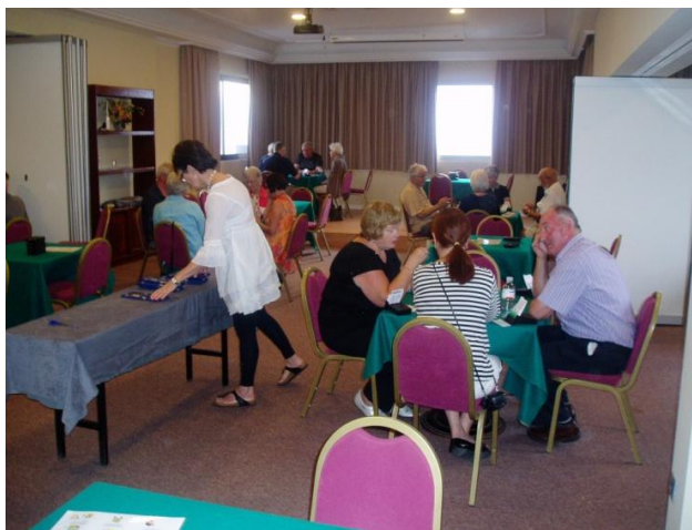
Fra spillelokalet i 6. etasje

Vi hadde ikke gjort det før tirsdag hvis vi ikke hadde feilkalkulert hvor mange vi kunne forvente mandag. Konferansesenteret ser ut til å fungere greit for inntil 20 bord og Atlante for inntil 18, så vi fortsetter med det også neste år. Generelt sett har vi inntrykk av at spillerne var fornøyd med lokalitetene, selv om det naturligvis forekom enkelte klager. Det er vanskelig å holde støynivået nede til tider med så mange ivrige bridgespillere i sving.