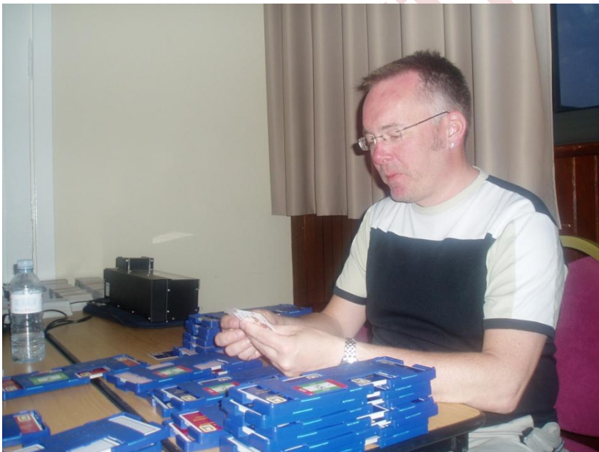
Presidenten hjalp til med dublring av kort